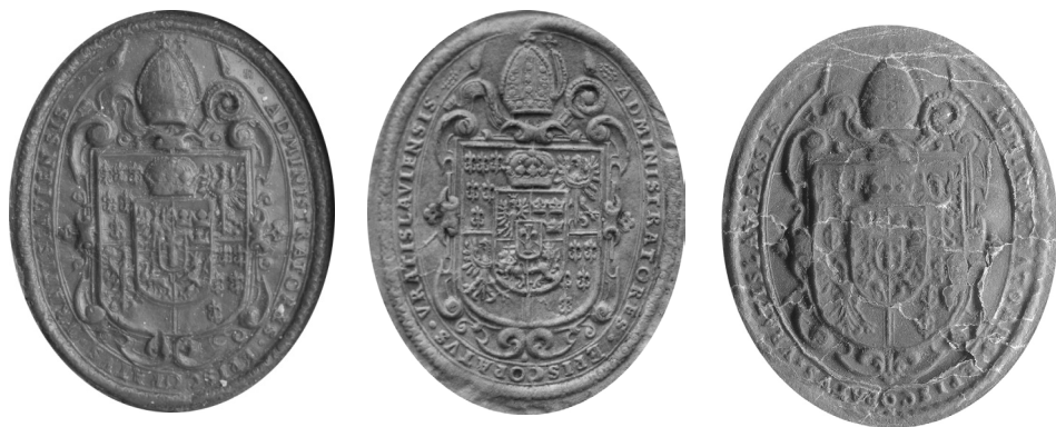
2. Pieczęcie administratorów diecezji wrocławskiej