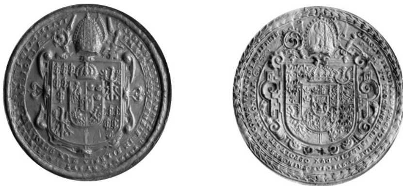
4. Trzecia i czwarta biskupia wrocławska pieczęć Karola Ferdynanda

Nową wyróżnia przede wszystkim zmiana układu herbów w tarczy środkowej, gdzie w polu pierwszym Orła polskiego zastąpiły szwedzkie trzy korony, ale też bogatsza ornamentyka obramienia tarczy, inna stylizacja krzywaśni pastorału i rękojeści miecza, a także wprowadzenie na początku i końcu drugiego wiersza legendy ozdobnych wici. Wspomniana wyżej zamiana herbów państwowych jest prawdopodobnie efektem pomyłki rytownika. Wskazuje na to poprawny układ owych herbów na pozostałych pieczęciach królewicza, emitowanych przezzeń w latach 1653–1654 monetach opolskich 17 , a także brak innego uzasadnienia dla wysunięcia herbu Szwecji przed koronnego Orła 18 . Nie słyszymy wszak o żadnych pretensjach Karola do szwedzkiego tronu. Sigillum tego używał królewicz zapewne aż do swej śmierci w 1655 r. Podobnie jak wcześniejsze pieczęcie biskupie wrocławskie i te nazywane są w koroboracjach dokumentów „naszą pieczęcią” ( sigillum nostrum ) 19 .