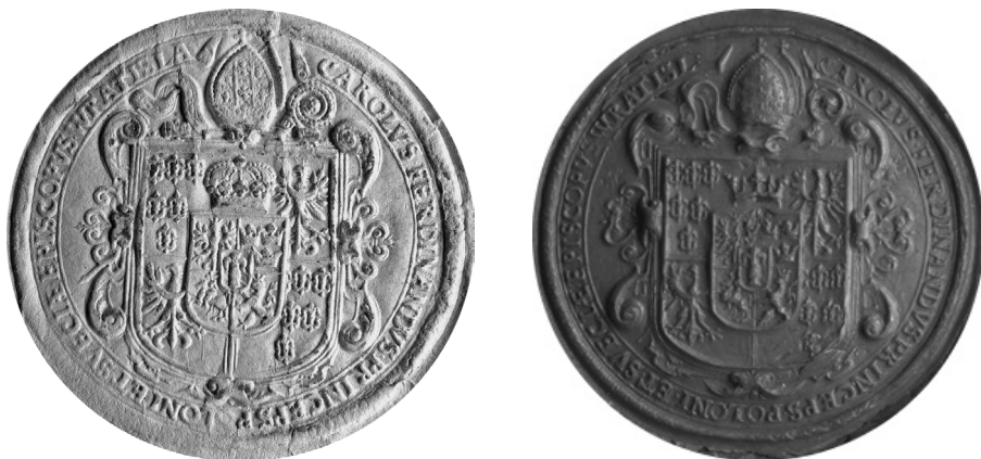
3. Pierwsza i druga pieczęć biskupia wrocławska Karola Ferdynanda

Dalsze pieczęcie wrocławskie Karola Ferdynanda wprowadzane były do użytku stopniowo w okresie po rezygnacji ze starań o polską koronę i uzyskaniu księstwa opolsko-raciborskiego. Pierwsza z powstałych wówczas pieczęci biskupich wrocławskich królewicza była również okrągła, ale nieco większa od poprzedniej (średnica 56 mm) 14 . Od wycofanego tłoka w sposób istotny różniła się jednak ikonografią i legendą. W jej polu wyobrażono zespół herbów dynastycznych, państwowych polsko-szwedzkich oraz księstwa nyskiego w układzie takim samym, jak opisany wyżej (na I i II pieczęci biskupiej wrocławskiej). Jednak nad tarczą główną, oprócz mitry biskupiej i pastorału widać rękojeść miecza symbolizującego świecką władzę biskupa tak w księstwie nyskim, jak i, być może, opolsko-raciborskim. W odróżnieniu od poprzednich pieczęci w tym przypadku legendę umieszczono w dwóch wierszach, także na wstędze o zrolowanych końcówkach. Inskrypcja nazywa Karola Ferdynanda z łaski Bożej królewiczem Polski i Szwecji, biskupem wrocławskim i plockim, a na Śląsku księciem w Opolu i Raciborzu 15 . Od 1653 r. oprócz tego sigillum biskup zaczyna używać nieco większej pieczęci (średnica 60 mm), o niemal identycznej ikonografii i legendzie, funkcjonującej początkowo równocześnie z poprzednią 16 .