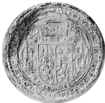
7. Pierwsza pieczęć „królewiczowska” Karola Ferdynanda (fot. M. Hlebionek, odcisk ze zbiorów WiMBPB)

Z 1651 r. pochodzą odciski kolejnej pieczęci Karola Ferdynanda, tym razem o całkowicie świeckiej ikonografii, ale z tytułami biskupimi w legendzie 31 . Pieczęć ta (średnica 55 mm) stylizacją jest zbliżona do opisanej wyżej trzeciej biskupiej pieczęci wrocławskiej Karola, używanej w latach 1650–1653. Jednak na interesującym nas typie oznaki godności biskupiej zostały zastąpione przez korony zamknięte: jedną umieszczoną nad tarczą główną, drugą zaś nad tarczą środkową 32 . Brak na niej również, w sferze ikonografii, odniesień do nyskiego księstwa, a na dziewięciopolowej tarczy herbowej znajduje się jedynie herb dynastyczny Wazów oraz państwowe herby Szwecji (w tarczy środkowej) i Rzeczypospolitej (w tarczy głównej). Legenda pieczęci odpowiada wspomnianej wyżej pieczęci wrocławskiej biskupiej, choć zauważyć trzeba, że, inaczej niż na śląskich pieczęciach biskupich