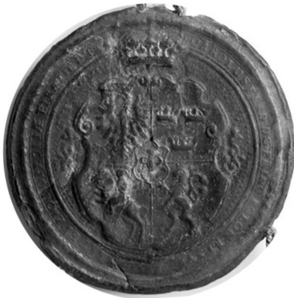
9. Książęca pieczęć opolsko-raciborska Karola Ferdynanda (fot. M. Hlebionek, odcisk z zasobu APWr.)

królewicza. Mierzy aż 96 mm średnicy 38 . W jej polu pod zamkniętą koroną królewską (zachodzącą na pole legendy) wyobrażono barokową, pięciopółową tarczę herbową, ze Snopkiem Wazów w polu sercowym, a w tarczy głównej w polu pierwszym polskim Orłem, w polu drugim szwedzkimi Trzema Koronami, w polu trzecim litewską Pogonią i, zapewne, Lwem Folkungów (przedstawionym jako wspięty Lew z rozdwojonym ogonem) w polu czwartym 39 . Resztę pola wypełnia drobny ornament roślinny. Legenda jej głosi: CAROLUS FERD(inandus) D(ei) G(ratia) PRINC(eps): POLON(iae) ET SVE[...W]RAT(islaviensis) ET PLOC(en-sis): OPPOLIAE ET RATIB(oriae) DUX.