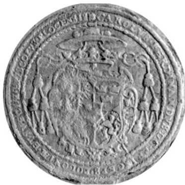
5. Plocka pieczęć biskupia Karola Ferdynanda