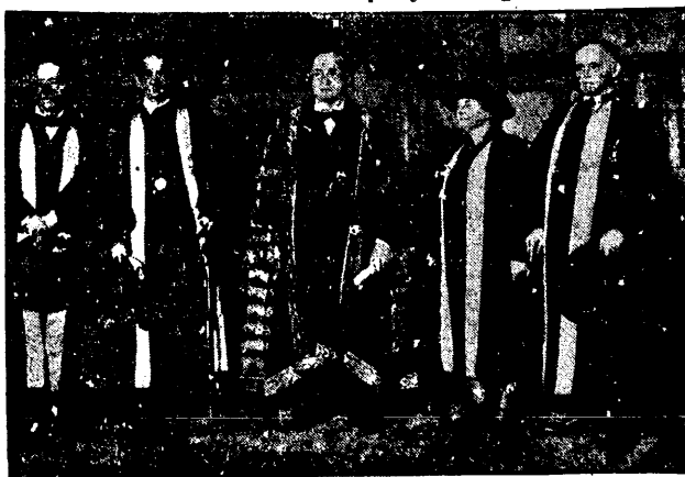
Z prawej ku lewej stoją: kanclerz Snowden, minister pracy Miss Matgorzata Bondfield, były kanclerz Winston Churchill, którzy otrzymali godność doktorów honorowych uniwersytetu bristolskiego.