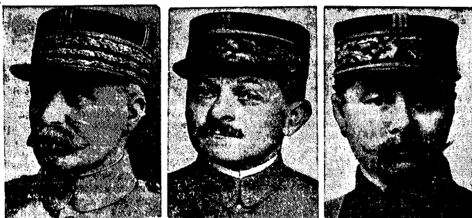
W kierownictwie armii francuskiej nastąpiły przesunięcia. I tak Marszałek Petain (pierwszy na lewo) złożył wiceprezidenturę Najwyższej Rady Wojskowej i generalny inspektorat, które objął gen. Weygand, dotychczasowy szef sztabu (w środku), szefostwo zaś sztabu przeszło w ręce generała Gamelin (na prawo).

Dolary 8,81-25. Nowy Jork 8,915. Nowy Jork kabel 8,924. Londyn 43,36-50. Paryż 35. Wiedeń 128,32. Praga 26,40. Włochy 46,73. Budapeszt 155,78. Szwajcaria 172,26. Sztokholm 239,05. Berlin 212,16. Dolar prywatny 8,91-25. Bank Polski 151,50. Bank Zachodni 70. Bank Z.w. Spół. Zarobek 65. Cukier 31. Lód 21. Norbł 31. Ostrowieckie 52. Starachowice 12,50.