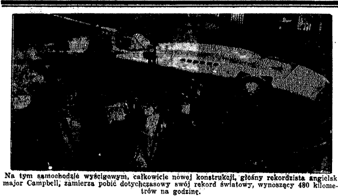
Na tym samochodzie wyścigowym, całkowicie nowej konstrukcji, główny rekordzista angielski major Campbell, zamierza pobić dotychczasowy swój rekord światowy, wynoszący 480 kilometrów na godzinę.