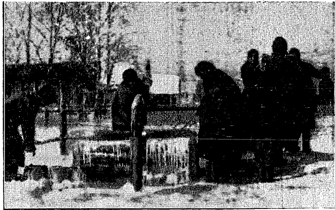
Silne mrozy, jakie nawiedziły ostatnio Polskę, w większym jeszcze stopniu dotknęły Rybę. Ludność we wsiach rosyjskich, chcąc się zaopatrzyć w wodę, zmuszona jest uprzednio do uwalniania studziń z okowów lodowych.

W wyniku wspomnianej akcji oraz poprzedniej w sprawie „Oberschl. Disconto Bank”, „Wspólnota Interesów” pozbyła się obciążen hipotecznych na olbrzymią sumę, sięgającą blisko 60 milionów złotych. Nie trzeba dowodzić, że wykreślenie tych olbrzymich obciążen hipotecznych stanowi bardzo poważne posunięcie na drodze uzdrowienia stosunków finansowych „Wspólnoty Interesów”.