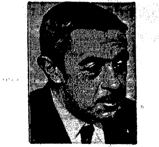
Pulkownik hiszpański Emilio Herrera, jak donoszą z Hiszpanji, zamierza w pierwszej połowie lutego wznieść się w stratosferie w otwartej gondoli balonu i nuciąc stamtąd sprawozdanie z dokonanych obserwacji przy pomocy aparatu radiowego...