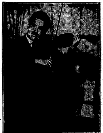
Dnia 2 lutego br. będzie obchodził 60-letnią rocznicę urodzin, niezwykle utalentowany, sławny sławy skrzypce-wirtuoz Fritz Kreisler. Skomponował on szereg efektywnych utworów skrzypcowych, zwłaszcza opracował melodię 3 tańców staroklasycznych.

Urząd śledczy prowadzi dochodzenia. Szkoda jest znaczna wskutek zniszczenia kas.