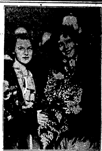
Śmiała lotniczka Amelia Earhart przeleciała przed kilku dniami Ocean Spokojny, dokonując pierwszego samotnego lotu na tak olbrzymiej przestrzeni. Lotniczce tej udało się już poprzednio dokonać kilku samotnych lotów nad oceanem Atlantyckim. W Oakland, gdzie p. Earhart wygłaszała, sprawiono jej żywiocław owacje. Ilustracja i przedstawia lotniczkę (na lewo) zaraz po przybyciu na lotnisko w Oakland w Kalifornii.

Następstwa zapowiedzi kanclerza Hitlera, że ustrój narodowo-socjalistyczny nie zanęca niczego, co może się przyczynić do rozwoju współpracy niemiecko-polskiej i do przemienienia jej powoli w trwałą przyjaźń — śledzić będziemy z żywym zainteresowaniem.