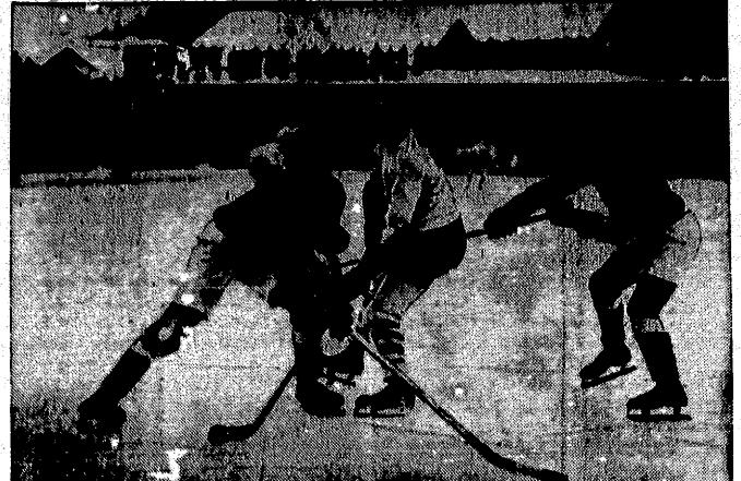
Hokeyowe mistrzostwa świata w Davos, trwające przelotnie zostały zakończone zwycięstwem pierwszego miejsca i tytułu mistrza świata przed bezkonkurencyjną Kanadą...