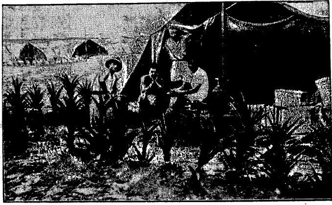
Zmobilizowane i wysłane do Afryki (Erytrea) oddziały wojsk włoskich obozują pod namiotami olbrzymich rozmiarów oczekując chwili, kiedy poderwie je rozkaz do marszu na głąb Abisynji.

udział 10 milionów faszystów, zmobilizowanych na rozkaz Mussoliniego. Sygnały te transmitowano w radio w ciągu 5 minut. Następnie rozległy się dźwięki marsza królewskiego i marsza faszystowskiego.