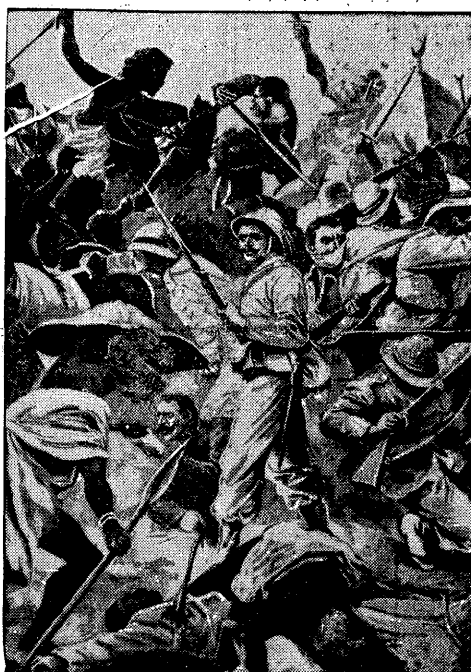
Współczesna ilustracja przedstawiająca klęskę Włochów pod Aduą w r. 1896.

ASMAR. Wojska włoskie, które w niedziele ranku zajęły Aduę, przywiozły ze sobą na samochodzie ciężarowym pomnik kamienny, - który ma stanąć w mieście ku czci żołnierzy włoskich, poległych podczas walk o Aduę w roku 1896.