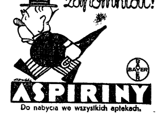
Do nabycia we wszystkich aptekach.

rafialnego. Po nabożeństwie pochód przez miasto do ( rodu zamkowego. Po przerwie efektowny pokaz napadu lotniczego i ataku gazowego, obrony przeciw gazowej i ratownictwa przeciwgazowego na placu Wolności przy udziale L. O. P. P., ochotniczej kolumny sanitarnej i straży pożarnej, pokaz ratownictwa ogólnego przy ul. Bytomskiej przy udziale O. K. S. Mysłowice. Po zakończeniu pokazów defilada drużyn ratowniczych, a o 5-iej po poł. uroczysta wieczornica w Katolickim Domu Ludowym. O godz. 20 zabawa taneczna w Kat. Domu Lud.