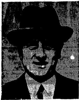
Sir Samuel Hoare.