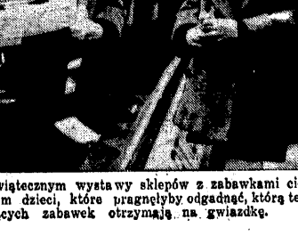
W okresie przedświątecznym wystawy sklepów z zabawkami cieszą się specjalnym wzięciem dzieci, która pragnęłyby odgadnąć, którą też z tych kuszących zabawek otrzymają na gwiazdkę.