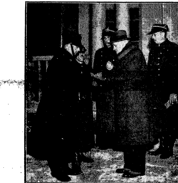
Pan Prezydent Rzplitej łamie się opłatkiem z żołnierzem, pełniącym wartę w wieczór wigilijny przed pałacem w Spale.