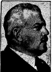
Następca zmarłego premiera greckiego i ministra spraw zagranicznych Grecji Demertzisa (na lewo) został generał Metaxas (na prawo).

Krwawe starcia w całej Hiszpanji. MADRYT. Po oficjalnych uroczystościach z okazji 5-lecia istnienia republiki hiszpańskiej, podczas których doszło do demonstracji w formie strzelania z rewol-