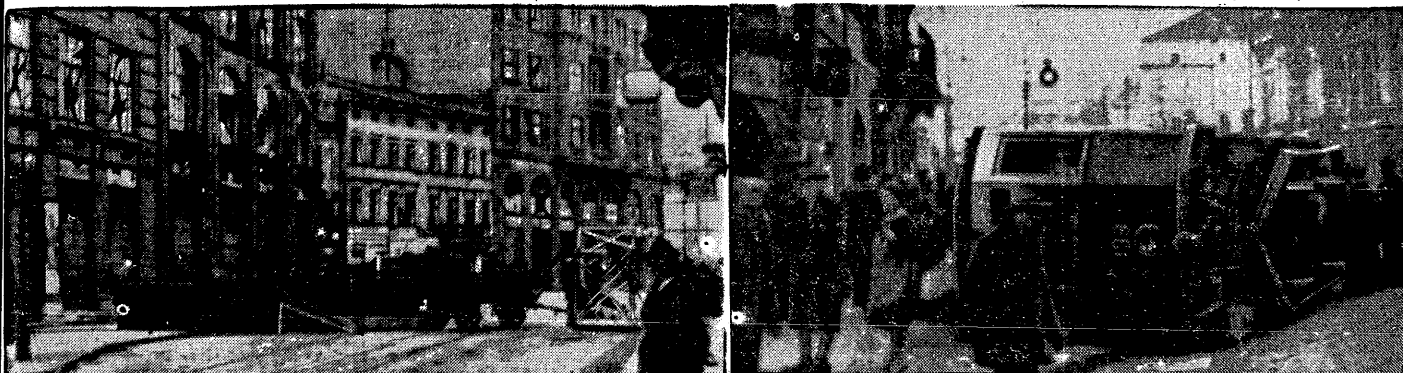
Dla uniemożliwienia akcji policji w czasie ostatnich pożarowania godnych wypadków we Lwowie podburzony tłum zatrasował ulice sprzątkami i wozami.