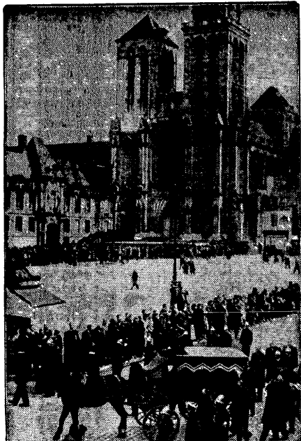
Zmarły niedawno b. francuski minister Cheron zastrzegł sobie w testamentie, aby pochowano go jaknajbardziej skromnie. Na zdjęciu pogrzeb m.in. Cheron, przechodzący ulicami Lisieux na cmentarz.