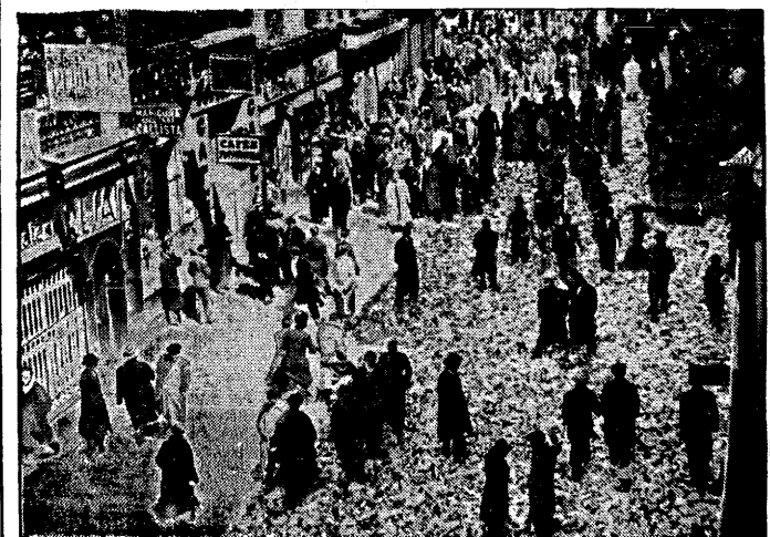
W czasie strajku generalnego dozło w Madrycie do groźnych zaburzeń ulicznych. Szczególnie ucerpiły wydawnictwa pism prawniczych, które żywiły lewicowe całkowicie szdemolowały a nakłady pism rozrzucały po ulicach. Na zdjęciu jedna z ulic madryckich zarożona zmieszonymi gazetami.

i co zatem idzie na cały dalszy bieg wypadków.