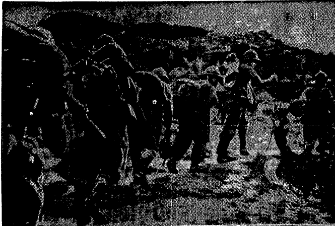
W sześciu dniach forsownym marszem przebyły wojska włoskie 200 km niezwykle uciążliwej trasy, zdobywając w celu Dessie, główną kwaterę negusa. Na zdjęciu czoło marszerującej kolumny wojska włoskiego.

Na tem nadzwyczajna sesja Rady zakończyła się.