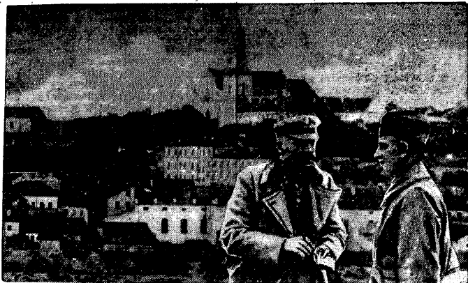
Marszałek Piłsudski w rozmowie z gen. Śmigłym-Rydzem. Zdjęcie z okresu bitwy nad Niemnem, w końcowej fazie kampanii polsko-bolszewickiej w 1920 r. Tło zdjęcia stanowi widok na Grodno, stanowiące wówczas ważny punkt strategiczny.

Sięgnijmy pamięcią w dniu listopada 1918 roku, poprzedzające powrót Komendanta z Magdeburga i objęcie przezeń rządu duszy w Polsce.