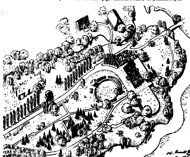
Plan sytuacyjny przyszłego Rezerwatu.

Teren pozostały ośrodka będzie odpowiednio przystosowany do celów ogrodniczo-ogrzarnych bez wprowadzania zbyt gruntownych zmian w jego ukształtowaniu dotychczasowym.