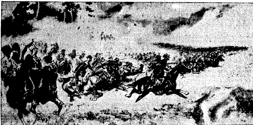
Z Wystawy Jubileuszowej Wojciecha Kossaka w Krakowie: Apoteoza.

Sprawa nadpłaty zarobków akordowych robotnikom huty „Zygmunt” (Hubertus) w Łagiewnikach nie została jeszcze dotychczas rozstrzygnięta. Jak wiadomo, robotnicy żądają 60.000 zł. nadpłaty, zaś dyrekcja godzi się nadpłacić tylko 15.000 zł. Propozycję dyrekcji robotnicy odrzucili, polecając radzie załogowej i specjalnej delegacji robotniczej dalsze prowadzenie pertraktacji z generalną dyrekcją Wspólnoty Interesów.