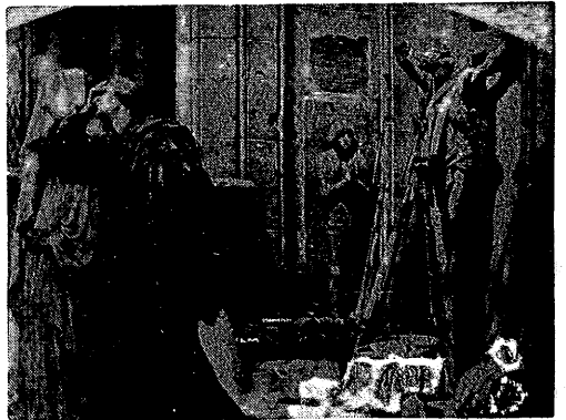
A. Grotoger — Sieroty — Z cyklu „Wojna” A. Grotoger — Zamykanie kościołów — Z cyklu „Warszawa”. A. Grotoger — Świętokradzawo. — Z cyklu „Wojna”.