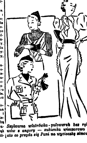
Sylwona wiatrówna-puloverka bez rękawów s angory - sukienka wieczorowa - oto co przyda się Pani na wycieczkę zimową.