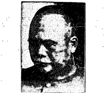
Gen. Ugaki, któremu Mikado powierzył utworzenie nowego japońskiego gabinetu ministrów.

Pobyt młodej pary holenderskiej w Krynicy ma potrwać jeszcze kilka dni, po czym, co już zostało ostatecznie zdecydowane, nastąpi wyjazd do Zakopanego. Dostojni goście udadzą się do Zakopanego przez Kraków celem zwiedzenia zabytków stolicy Jagiellonów.