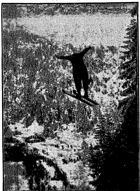
Z zawodów narciarskich o mistrzostwo Polski w Wisłie: Rajski Adam („Wiąta” Zakopane) w skoku na skoczni w Głębcu.

to podatek od piwa wykazuje bardzo powolną tendencję wzrostową, jest on nadmierny i hamuje konsumpcję. Podatek od cukru preliniuje się na 130 milionów zł, co jest uzasadnione tendencją wzrostową konsumpcji cukru. Podatek od olejów mineralnych przewiduje zwykłą konsumpcję co do benzyny o 10%, a co do nafty o 6%.