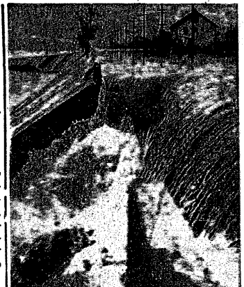
Obrazek z katastrofalnej powodzi w dorzeczu Missisipi. Napór wezbranych wód łamie murowany wał ochronny.

Oto w najogólniejszych zarysach i tylko w głównych punktach plan zamierzonej reformy. Powita ją z pewnością społeczeństwo z uznaniem. Gdyż zmiany ustawowe, zmierzające do usprawnienia ochrony Państwa i społeczeństwa, do zahamowania wzrostu przestępczości — są sprawą nader aktualną i w świadomości każdego prawego obywatela zrozumiałą.