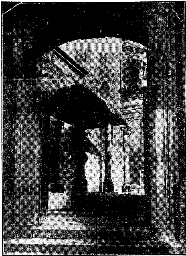
Uważałem nad zejściem do krypty Marszałka Piłsudskiego w wieży Srebrnych Dzwonów.