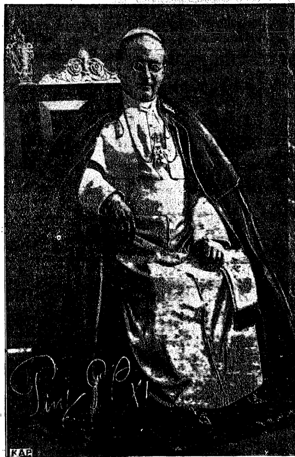
Dnia 6 bm. Stolica Apostolska święciła wraz z całym światem katolickim piętnastą rocznicę pontyfikatu Papieża Piusa XI, byłego Nuncjusza Apostolskiego w Polsce (lata 1919-1921). Obywatela dąlatoskiego i niezmarowidzanego oddania się obowiązkom pontyfikatu - oto treść panowania Piusa XI jako Głowy Kościoła od pierwszej chwili powołania Go na tron papieski.