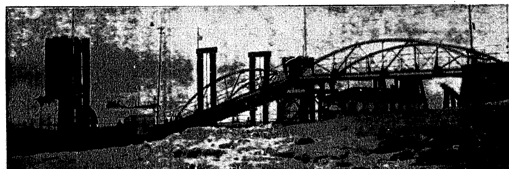
Ostatnie wiatry wschodnie do tego stopnia obniżyły stan wody na rzece Zabis, że utrudniły komunikację.