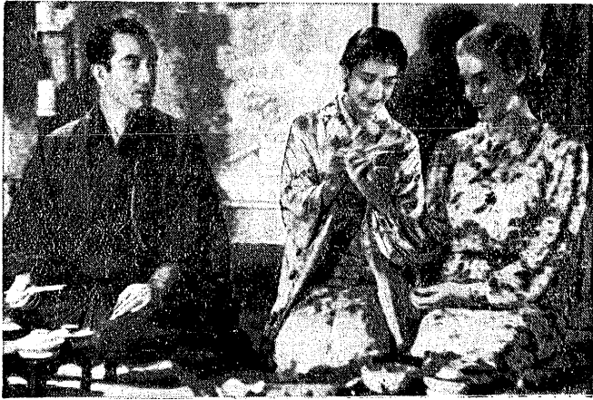
Uroczą córkę samuraja japońskiego uczy europejskojczykoj jak się ładu pałeczkami.