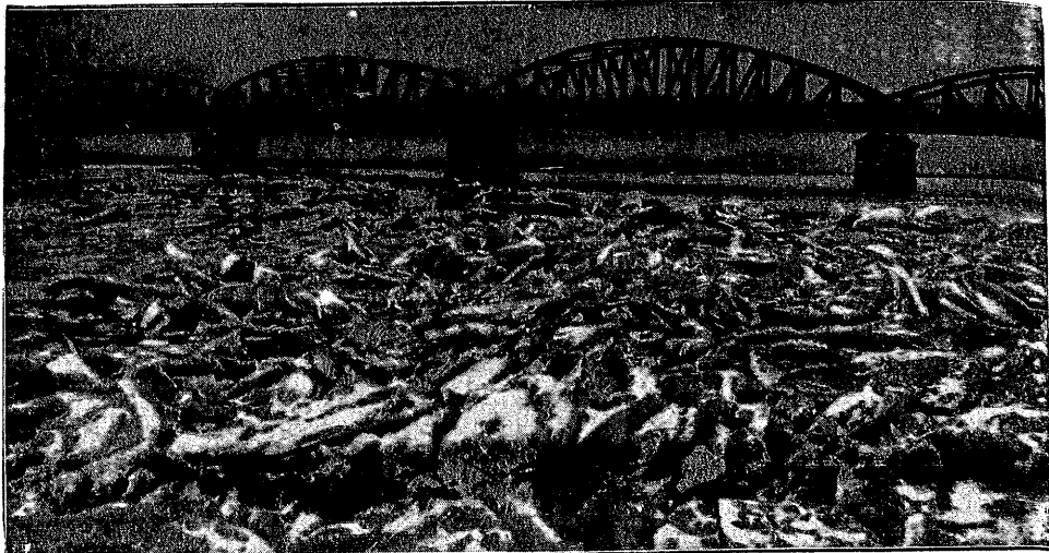
Skutki ostatnich mrozów na rzece Odrze.