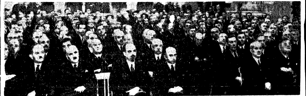
Uczestnicy zjazdu mieszczaństwa polskiego ze wszystkich stron Polski (155 miast) jaki odbył się w ub. poniedziałek w Warszawie, oczekując otwarcia uroczystości aktu zjednoczenia narodowego. W środku płk Adam Koc.

Bo był ideałem Kapłana-Obywatela, Rycerzem Sprawy narodowej!