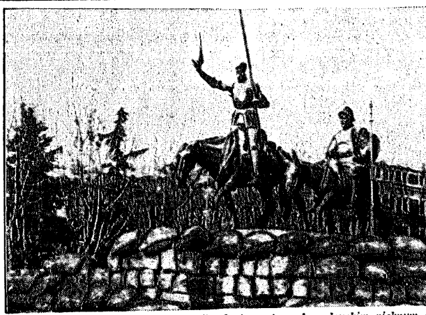
Bratobójcza wojna hiszpańska doprowadziła do tego, że pod madyryckim pięknym pomnikiem Don Kiszota ułożono barykadę.

PARYŻ. Agencja Havasa podaje: zwołano dano powód do powstania w kołach politycznych najrozmaitszych poglądów.