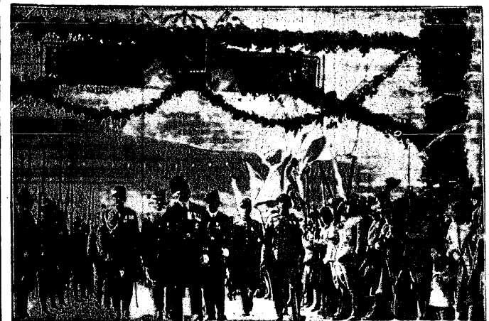
Król grecki Jerzy II odbywa podróż lustracyjną po kraju. Na zdjęciu moment przybycia króla na wyspę Samos.

W wotach wnioskach postanowiono zorganizować w b. sezonie bieg kolarski Warszawa — Śląsk, oraz corocznie rozgrywać specjalny bieg o nagrodę śp. Strzałkowskiego.