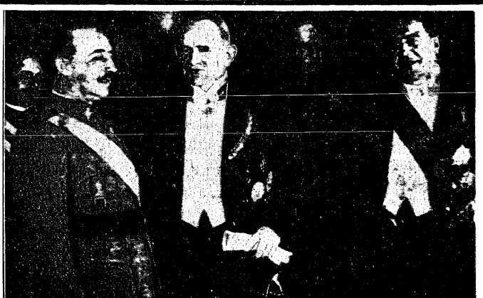
Ambasador niemiecki gen. Faupel (po środku) przy rządzie gen. Franco (na lewo) wręczył swe listy uwierzytelniające. Na prawo stoi minister spraw zagranicznych rządu powstańczego Sangroncs.

Pod Fordonem, gdzie stan wody wynosi 6,50 mtr. ponad stan normalny, ruszyły lody na lewy brzeg Wisły do wsi Strzelce Dolne i Potecz. Nowe kry napływają w dalszym ciągu i tarasują Wisłę na całej przestrzeni. Brda od ujścia aż do miasta wystąpiła z brzegów, zalewając w Bydgoszczy nadbrzeżne domy i fabryki i dochodzi już do urzędu pocztowego. Szosa, prowadząca z Bydgoszczy do Solca kujawskiego jest zalana w Łęgowie (8 km. od Bydgoszczy). Wszelkie wysiłki rozbicia zatoru są bardzo utrudnione. Na miejsce powołał wyjechał starosta powiatowy, który wydaje zarządzenia doraźne celem obrony ludności.