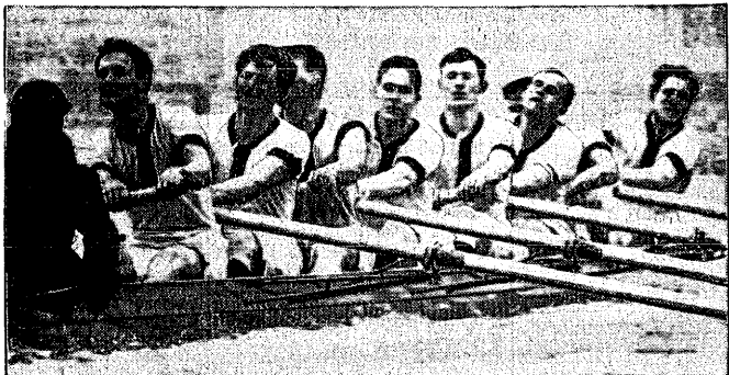
Osada Oxfordu pilnie trenuje przed słynnym dorocznym wyścigiem regat Oxford - Cambridge.