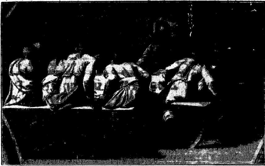
„Ostatnia Wieczerza” — obraz Rafaela (ze zbiorów w Watykanie).

(-) W połowie kwietnia rb. rozpoczyna się w Warszawie wykłady z zakresu ratownictwa dla młodzieży dokształcających szkół zawodowych, zorganizowane przez miejską służbę zdrowia w porozumieniu z władzami wojskowymi. Program wykładów przewiduje: ratownictwo w nagłych wypadkach, pomoc chirurgiczną, przepedeutykę gazoznawstwa. Wykłady prowadzić będą podchorążowie sanitarni.