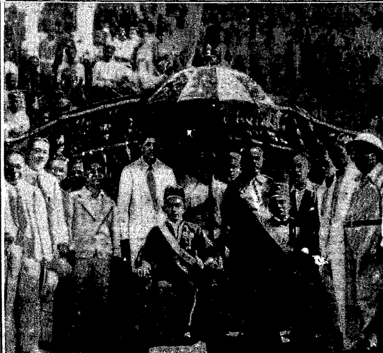
Na Filipinach, pozostających pod protektoratem St. Zjednoczonych Ameryki, władzę sprawuje, udzielny książę Jainał Abirrin II, Na zdjęciu uroczystość wprowadzenia na tron nowego władcy.