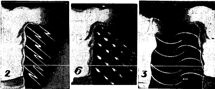
Islandzkiemu fizykowi prof. Kollmannowi udało się po długich próbach dokonać zdjęcia fal elektrycznych, jakie wydziela ze siebie organizm ludzki. Oto uchwycone na kliszy trzy klasyczne typy fal: Te na lewo, podobne do błysku gromu, wydzielały ze siebie ludzie w momencie silnego gniewu, następnym rodzajem kroplistych fal charakteryzujących zdeklarowanego pijaka, a wreszcie trzeci gatunek fal ma bardzo znamienne znaczenie, bowiem wydziela je czująca do siebie dużą sympatię para. Jak widać fale te mają tendencję do wzajemnego połączenia się.