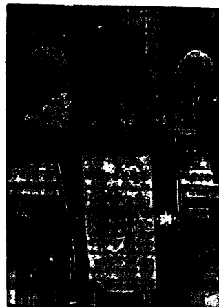
Papież Pius XI udziela z balkonu Bazyliki św. Piotra w Rzymie tegorocznego błogosławieństwa wielkanocnego.