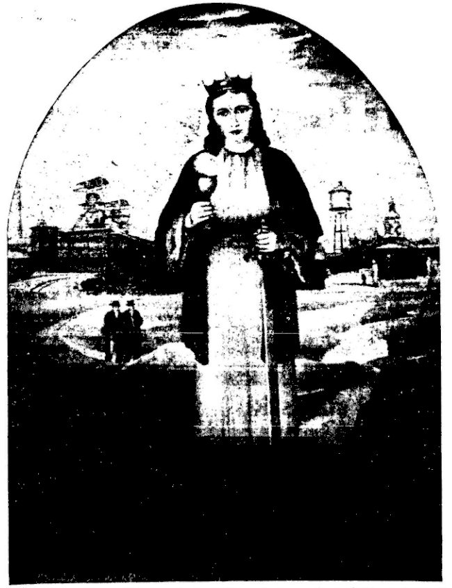
Patronka Górników. — Zdjęcie z obrazu olejnego znanego malarza śląskiego Franciszka Sikory.

W niedzielę 5 grudnia br. w sali p. Brzódki w Tychach odbędzie się zebranie dróżników powiatu pszczyńskiego. Początek zebrania o godz. 12. Na porządku dziennym c.d.r.d. znajdują się tak ważne sprawy, jak wybory do rady zakładowej, wypowiedzenie taryfy i kasa pogrzebowa.