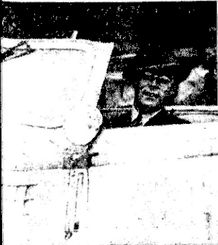
Włócznie holenderskiej następczyni tronu ks. Bernard miał onegdaj groźny wypadek samochodowy, spowodowany zdarzeniem w się samochodu księcia z autem ciężarowym. Ks. Bernard odniósł poważne kontuzje, z których jeden z nich jest obecnie w szpitalu. Na zdjęciu widzimy ks. Bernard w samochodzie

AMSTERDAM. Stan zdrowia księcia Bernarda stale się poprawia. Obecnie już nie trzyma żadne poważniejsze niebezpieczeństwa. Książę jest w dobrym humorze i ma dobytą siłę.