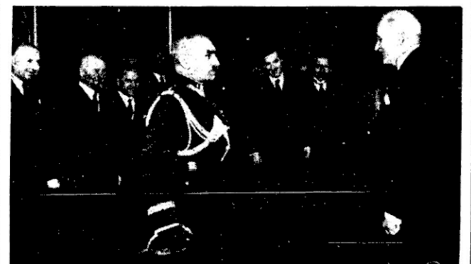
Dnia 1 grudnia przypada 70-letnia rocznica urodzin Pana Prezydenta Rzeczypospolitej prof. dr Ignacego Mościckiego. Zdjęcie nasze przedstawia moment składania życzeń Panu Prezydentowi Rzeczypospolitej przez Rząd z Panem Premierem gen. Sławojem Skłodowskim na czele, marszałkiem Senatu i Sejmu oraz prezbisem Najwyższej Instancji Sądowej...