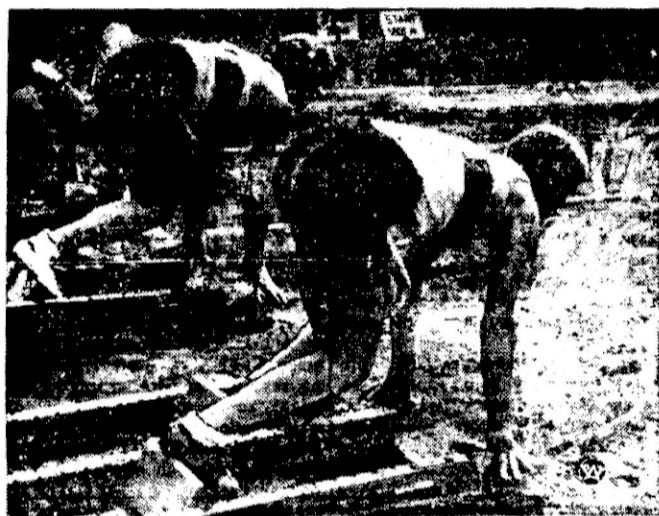
W czasie odbywających się ostatnio zawodów sportowych we Wrocławiu, zastosowano nowe oryginalne urządzenia startowe.

Szwajcar: — Będziemy nareszcie mieli wkrótce ministra marynarki. Niemiec: — Na co wam minister marynarki, kiedy nie macie floty? Szwajcar: — A na co wam minister... sprawiedliwości?