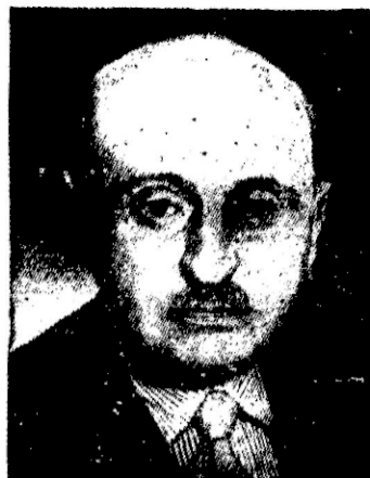
Przewodniczący Międzynarodowego Komitetu Olimpijskiego, hr. Baillet-Latour, który przyczynił się do powierzenia Finlandii organizacji Olimpiady w r. 1940 — po wycofaniu się Japonii.