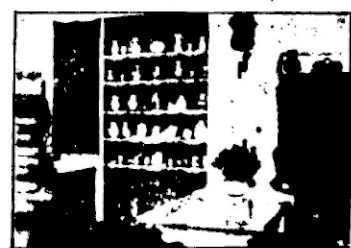
Dział ceramiki w Śl. Bazarze Ludowym w Katowicach.

(ors) Na obszarze województwa śląskiego istniały od szeregu lat dwa towarzystwa, mające na celu popieranie przemysłu ludowego: jedno w Częstochowie, drugie w Katowicach. Na życzenie wojewody śląskiego obydwie towarzystwa połączyły się w jedno pod nazwą