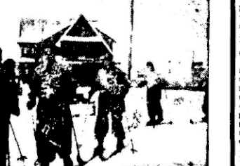
Bierusze kroki na śniegu.