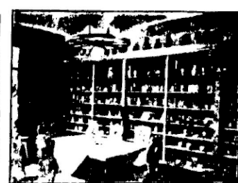
Świeclica Śl. Tow. Pop. Przemysłu Ludowego i Chałupniczego w Częstochowie.