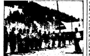
Poronna zbiórka obozu U. S.

I w tym roku jak zwykle rozciąsał się w Poroninie oboz wypoczynkowy dla robotnic organizowany przez Państwowy Urząd WF i PW w Krakowie a utrzymywany przez Zakład Ubezpieczeń Społecznych. Ponad 500 młodych robotnic w wieku od 16 do 20 lat przejdzie przez oboz wykonywując w ten sposób swoje dwutygodniowe urlopy fabryczne. Oboz trwa od 28. 12. 1938 r. do 5 marca, w turnusach po mniej więcej sto osób z całej Polski; z Pomorza, Warszawy, z dalekich Kresów Wschodnich, a po dwa tygodniach wracają do domów z nowym zapasem sił do pracy i zapasem radości na długie dni fabrycznej harówki. Większość to młode dziewczęta, ale są między nimi i starsze kobiety, które po raz pierwszy w życiu mają możliwość spędzenia urlopu w takich warunkach zdrowotnych, jakich nie posiadają przez cały rok. Ten urlop w górach staje się dla nich swego rodzaju objawieniem — zima spędzona w górach, narty — wszystko to staje się stop-