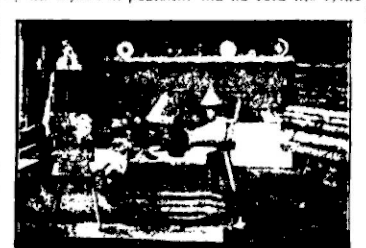
Piękny zakątek w Śl. Bazarze Ludowym w Katowicach.