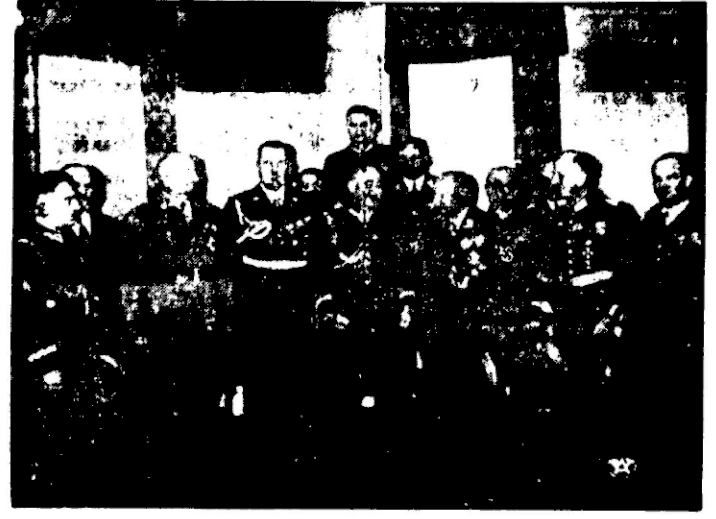
Delegaci Międzynarodowego Komitetu b. Kombatanów z ks. Coburg-Gotha na czele w Pana Marszałka Śmigłego-Rydza.