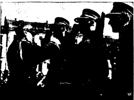
Na zdjęciu po prawej stronie: W dniu 7 czerwca br. Pan Minister Spraw Zagranicznych płk. Józef Beck przyjął delegację pułku piechoty in. płk. Lisa-Kuli z dowódcą pułku na czele, która wręczyła Panu Ministrowi odznakę honorową pułku wraz z dyplomem, nadaną w 20-ą rocznicę istnienia pułku, w dowód czci i uznania dla Pana Ministra, jako najbliższego towarzysza broni szefa pułku Lisa-Kuli, oraz w związku z ostatnimi historycznymi osiągnięciami Polski na terenie międzynarodowym. — Pan Minister J. Beck w otoczeniu członków delegacji.

WSZYSCY PAMIĘTAJMY, ŻE JUNDUSZ OBRONY NARODOWEJ, MA KONTO P. K. O. NR 370.000