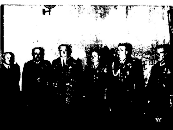
Na zdjęciu z lewej strony: Moment dekoracji przez Pana Premiera oficerów i szeregowych Straży Pożarnej na pl. Marszałka Piłsudskiego w Warszawie.