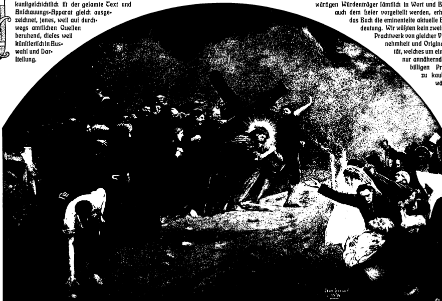
Jean Béraud, Der Kreuzweg. (Musée du Louvre, Paris).

... Papier, Druck und überhaupt die ganze Ausstattung sind ersten Ranges und stellen das Werk auf die höchste Höhe der modernen künstlerisch technischen Vollendung. ... nicht die Namen der gegenwärtigen Träger der höchsten Würden und Ämter in Rom sind die Hauptfläche, sondern die Ämter und ihre Arbeiten selbst, welche ja stets bleiben werden, und darin liegt der dauernde Wert des unendlich belehrenden und gänzlich neuen Inhaltes des Werkes; ... da die gegenwärtigen Würdenträger sämtlich in Wort und Bild auch dem Leser vorgeführt werden, erhält das Buch die eminenteste aktuelle Bedeutung. Wir wüßten kein zweites Prachtwerk von gleicher Vornehmheit und Originalität, welches um einen nur annähernd so billigen Preis zu kaufen wäre.