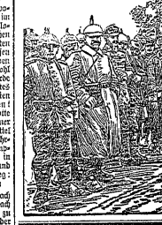
Die Gegend unter dem Namen...