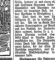
Die Gegend unter dem Namen...