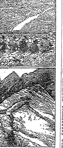
Die neue Stellung in der italienischen Front...