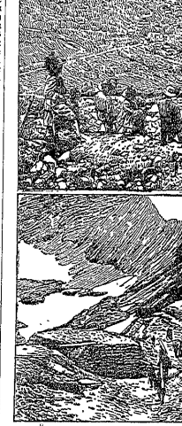
Die neue Stellung in der italienischen Front...