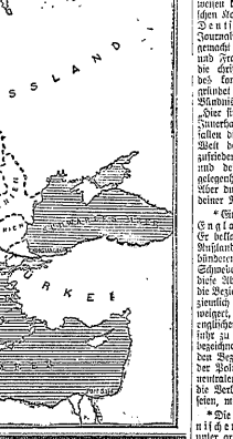
(Von der Mitte bis zum Rand.)

Die Macht am Ionzo. Die Macht am Ionzo. Die Macht am Ionzo.