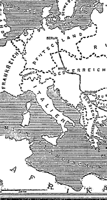
(Von der Mitte bis zum Rand.)

Die Macht am Ionzo. Die Macht am Ionzo. Die Macht am Ionzo.