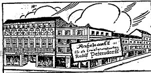
Breslau Ohlauer Straße 8