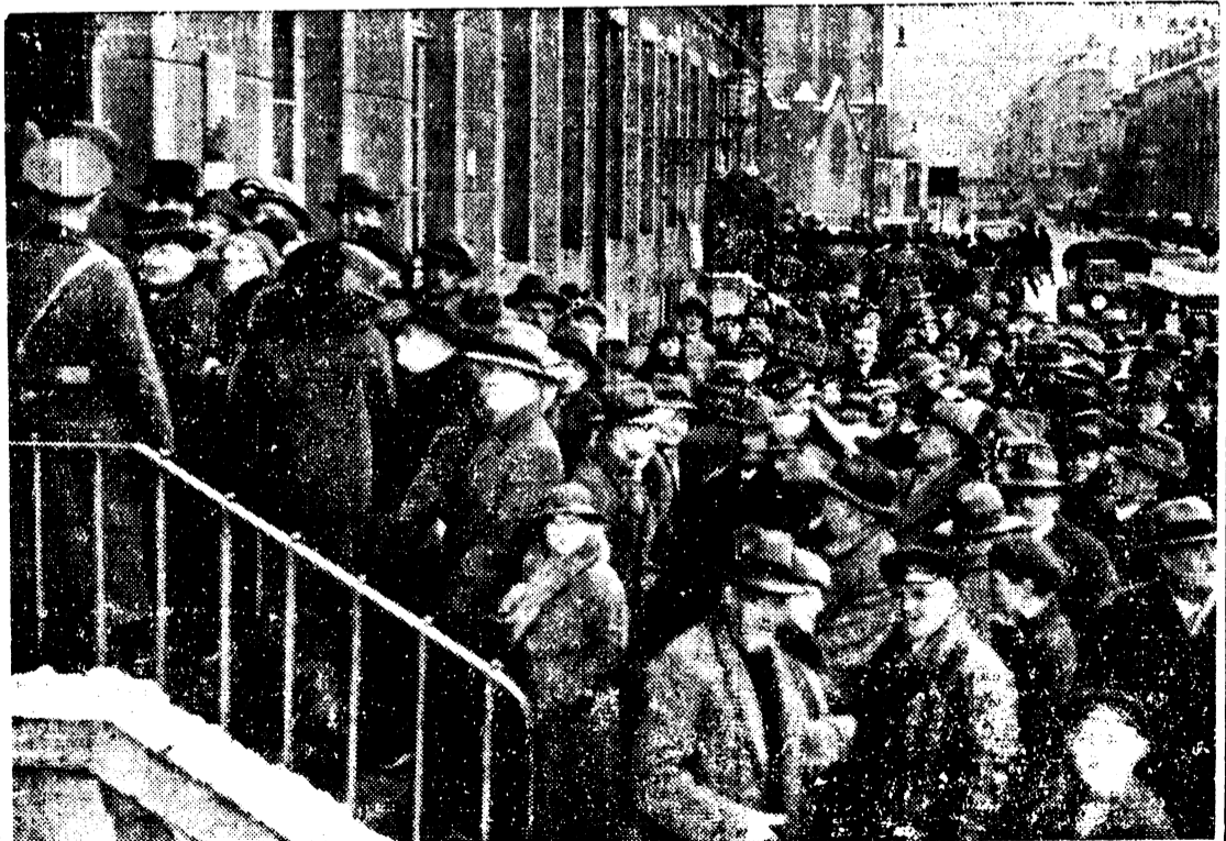
Alle, alle gaben ihre Stimme ab.

Am Abend, schon gegen 18 Uhr, ist der Andrang in den Wahllokalen fast überall abgeebbt.