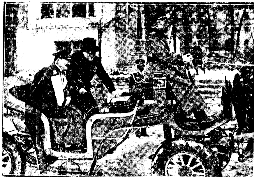
Der Ministerpräsident in seinem Jagdwagen.