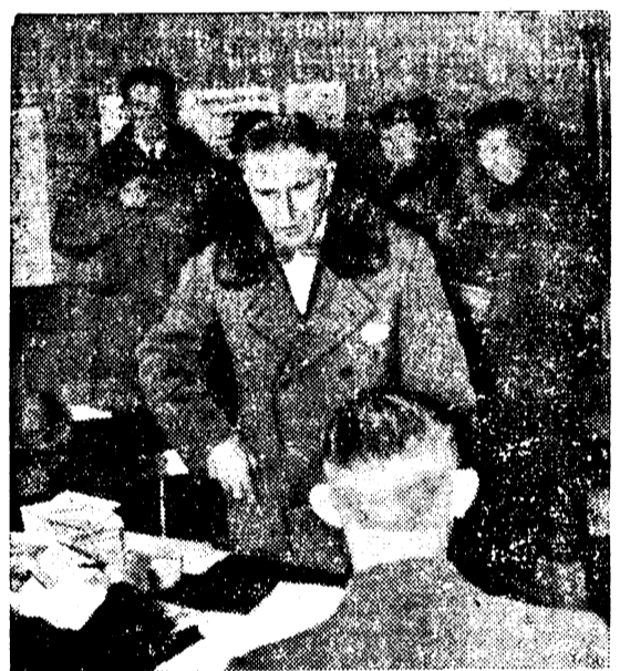
Herr von Papen an der Wahlurne.

Der Deutsche Rundfunk und die ihm angeschlossenen Sender der Welt übertragen am Dienstag morgen um 8 Uhr aus Saarbrücken das Abstimmungsergebnis des 13. Januar. Unmittelbar im Anschluß an die Verkündung des Abstimmungsergebnisses spricht der Saarbevollmächtigte des Führers und Reichskanzlers und wird dem deutschen Volke und seinem Führer das Ergebnis melden. Angesichts des großen geschichtlichen Augenblicks versammelt sich das deutsche Volk zum Gemeinschaftsempfang an den Lautsprechern.