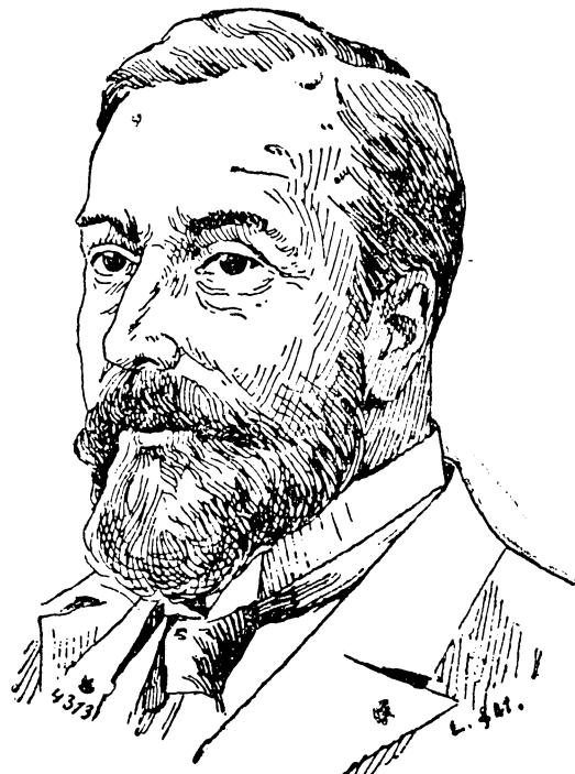
Der neue Kolonialdirektor Bernhard Dernburg.

Betreffs der Versorgung Deutschlands mit Fleisch sind an den Reichskanzler erneute Forde- rungen vom deutschen Fleischerverbande gerichtet worden. Sie betreffen u. a. die Zulassung dänischen und schwedischen Rindviehs und eines Schweine- kontingents aus Frankreich, Holland und Dänemark. Die Akwa-Stämme in Kamerun haben eine neue Petition an den deutschen Reichstag gerichtet. Die Fahrkartensteuer brachte im abgelaufenen ersten Monat ihrer Einführung dem Reiche erheb-