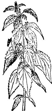
Nur echt mit Brennessel.

Nebenstehende Marke gilt als einziges Zeichen der Echtheit von